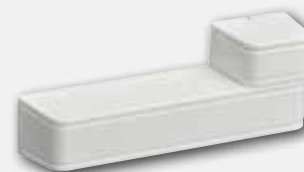
Contacto de porta/janela (montagem saliente) RFDW-SM