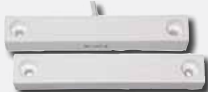
Contacto de porta/janela