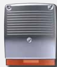
Sirene/strobe com fios