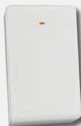
Repetidor RADION RFRP