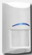
Detector de movimentos (com fios ou via rádio)

O utilizador poderá escolher de entre uma vasta gama de componentes e acessórios para compor um sistema completo, que corresponda exactamente às suas necessidades, tornando assim as residências e as pequenas empresas mais seguras.