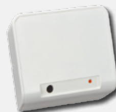
Detector de quebra de vidros RADION