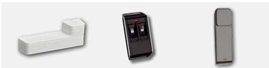
Contacto de porta/janela (montagem saliente) RFDW-SM