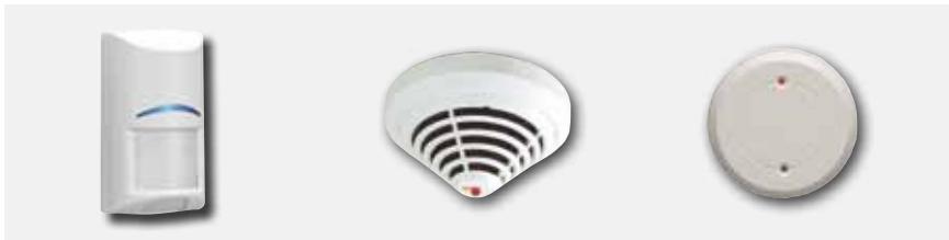
Detector de movimentos

Dispositivos periféricos (com fios ou via rádio):