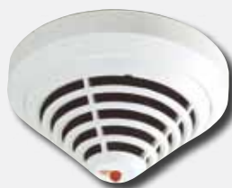
Detector de incêndio