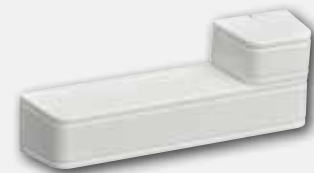
RFDW-SM Tür-/Fenster-Magnetkontakte (Aufputz-Montage)