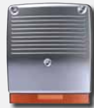
Akustischer/optischer Signalgeber, verdrahtet, für den Außenbereich