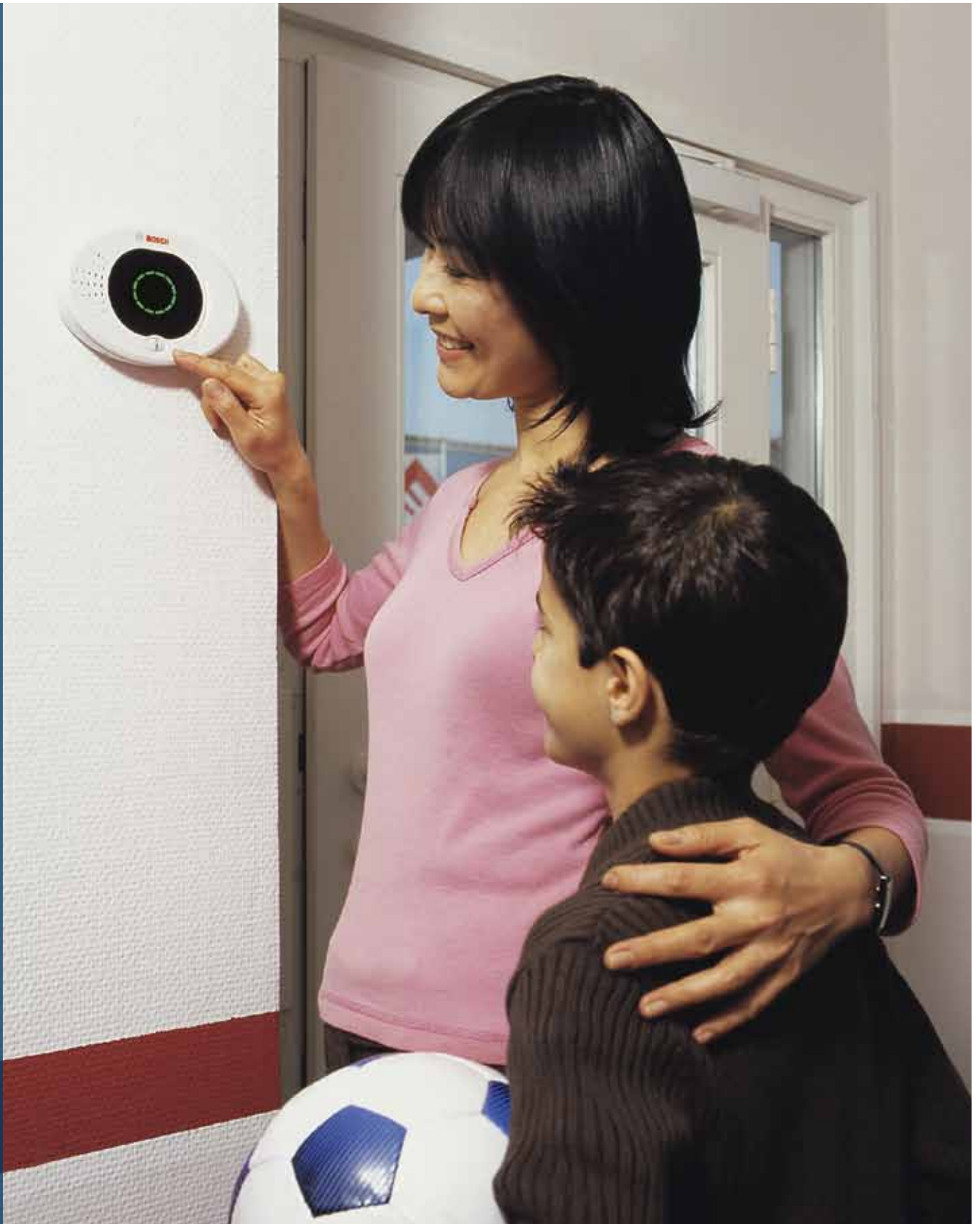
Das Bedienteil zeichnet sich durch eine klar erkennbare, mehrfarbige Anzeigetechnologie mit Symbolen, Sprache und Lautstärke aus.