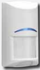
Bewegungsmelder – verdrahtet oder drahtlos

Es ist genau auf Ihre individuellen Bedürfnisse zugeschnitten und sorgt in privaten Haushalten und kleinen Gewerbebetrieben für optimale Sicherheit.