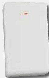
RADION Repeater RFRP