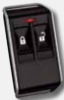
RADION drahtloser tragbarer Funksender RKF-TB