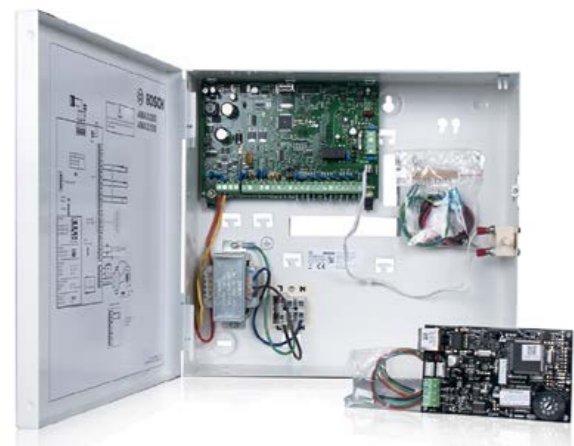
Tecnologia dei sistemi integrata: tutte le versioni della famiglia di prodotti AMAX presentano la stessa struttura

Bosch si assume la responsabilità della sicurezza e della protezione dei clienti offrendo sistemi di allarme intrusione leader di settore e di altissima qualità: la famiglia di prodotti AMAX di Bosch è una piattaforma scalabile che consente di rispondere alle esigenze specifiche dei clienti, dalle applicazioni residenziali a quelle commerciali di piccole e medie dimensioni.